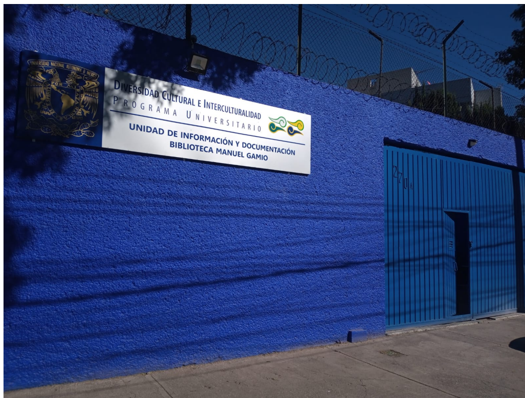
Imagen 17: Fachada de la Unidad de Información y Documentación. Biblioteca Manuel Gamio