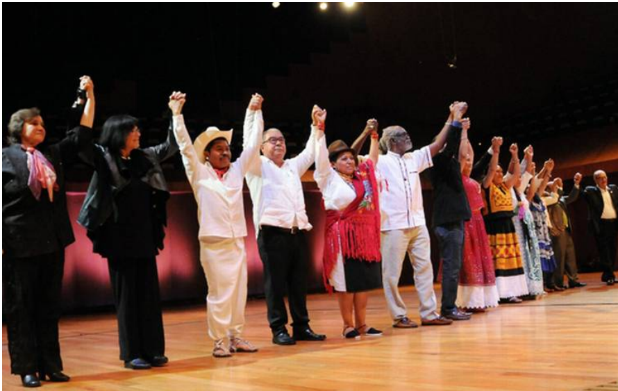
Imagen 8: VIII Edición del Festival en la Sala Nezahualcóyotl

eventos para destacar el importante papel del Festival como un espacio de convergencia identitaria: el conversatorio A 16 años de la Fiesta de la Palabra "Carlos Montemayor" y el recital FestiLive de poesía, que se llevaron a cabo el 28 y 29 de octubre; ambos eventos fueron transmitidos en vivo a través del canal de Facebook del PUIC.