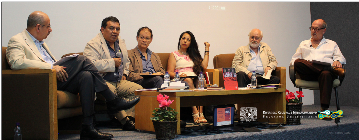
Imagen 21: Panel mesa redonda consulta y gobernabilidad

de Capacitación Integral para Promotores Comunitarios; Profesional Indígena de Asesoría, Defensa y Traducción; organizaciones y autoridades del pueblo afromexicano de Guerrero, Coordinadora Regional de Autoridades Comunitarias-Policía Comunitaria de Guerrero, Ojo de Agua Comunicación, Radio Comunitaria Jënpoj, Radio Comunitaria Totopo y Radio Nahndia, así como instituciones del extranjero: EDF-Electricidad de Francia, Cooperación Técnica Alemana, Embajada de Canadá, División Derechos Humanos de Uruguay y el Ministerio de Cultura de El Salvador.