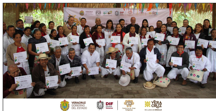
Imagen 10: Diplomado sobre Medicina Tradicional Totonaca

El PUIC compartió la coordinación del Diplomado con el Centro de las Artes Indígenas de Papantla, Veracruz, y el DIF del estado de Veracruz. Es necesario señalar que éste es el primer diplomado en su tipo, ya que la impartición de las clases estuvo bajo la responsabilidad de 16 terapeutas tradicionales indígenas y siete profesores adscritos al PUIC y a las facultades de Medicina y Filosofía y Letras de la UNAM. El diplomado inició el 10 de octubre de 2019 y concluyó el 6 de febrero de 2020, en Papantla, Veracruz, tuvo una duración de 40 horas, distribuidas en cinco meses, en las cuales los terapeutas tradicionales transmitieron a la nueva generación (14 alumnos indígenas totonacas) sus conocimientos médicos, además de incluir la enseñanza de la lengua materna. El Instituto Nacional para los Pueblos Indígenas (INPI) apoyó esta iniciativa con el otorgamiento de becas para alumnos y profesores de la comunidad totonaca participantes.