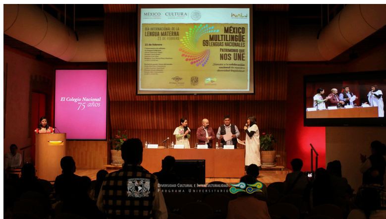
Imagen 2: Diplomado para Editores en Lenguas Indígenas