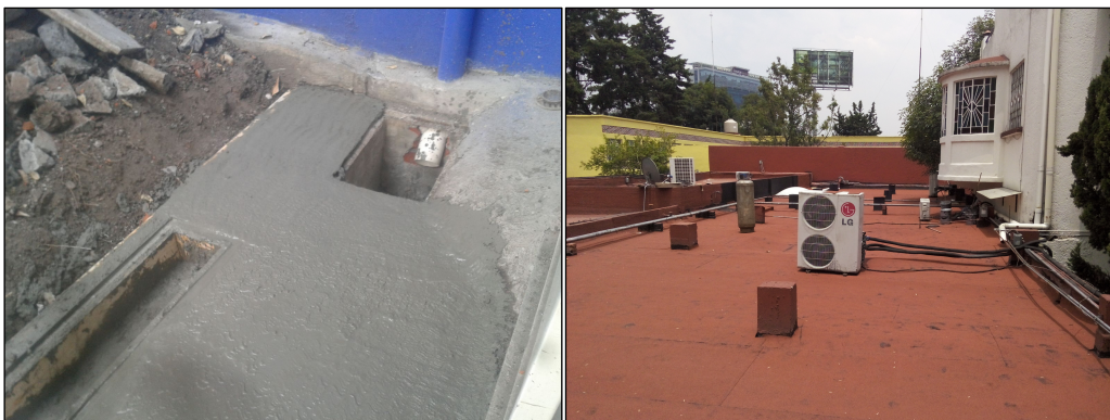
Imagen 22: Trampas de agua en jardín interno y reubicación de tuberías de aire acondicionado

Los principales trabajos de rehabilitación y mantenimiento, realizados en la última etapa de las obras, consistieron en modificar y sustituir la instalación eléctrica y colocar un transformador. Asimismo, se rehabilitó la red de drenaje, se impermeabilizaron muros y azotea, para evitar filtración de agua y prevenir daños al valioso material documental y equipo electrónico que aloja el inmueble. Se realizó también la instalación del sistema de voz y datos, y cámaras de video vigilancia en el exterior. En lo que respecta a la sede Loreto, en 2021 se hicieron trabajos de impermeabilización y cambio del domo del pasillo principal, solucionando así filtraciones de agua al interior de las oficinas.