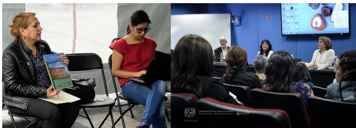
Imagen 6: Seminario Permanente Migración Indígena

Con el propósito de analizar la problemática de la población indígena migrante, establecer contacto con organizaciones sociales de migrantes y acordar actividades conjuntas, en noviembre de 2018 se llevó a cabo un conversatorio sobre Transferencias Salariales y Migración, como parte de las actividades del Foro Mundial de las Migraciones, realizado en el Centro Cultural Tlatelolco de la UNAM. El evento concluyó con la iniciativa de organizar una reunión con especialistas del tema y migrantes, con la finalidad de generar propuestas de políticas públicas orientadas a la atención de la población indígena migrante.