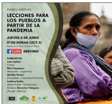
Imagen 12: Paneles Virtuales: Pueblos Indígenas y COVID-19

transmitidos en vivo a través de las redes sociales de SERVINDI. Cada panel contó con expertos y líderes sociales de América Latina. Los temas que se abordaron fueron: Medios, pandemia y pueblos indígenas; Desafíos de la diversidad cultural; Amazonia, pandemia y resistencia indígena; Lecciones para los pueblos a partir de la pandemia; y Mesoamérica resiste: pandemia e infraestructura y Autonomía, libre determinación y decolonialidad del poder.