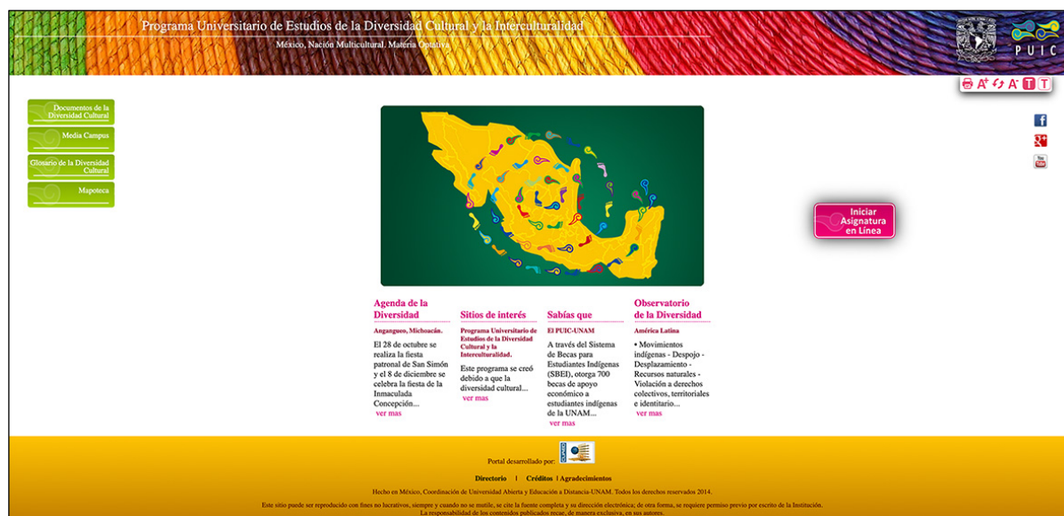
Imagen 1: Plataforma de la materia optativa en la modalidad Abierta y a Distancia

del Desarrollo de Chile, de Costa Rica, de Bolonia (Italia) y de Zúrich (Suiza); además algunos asistieron como público en general.