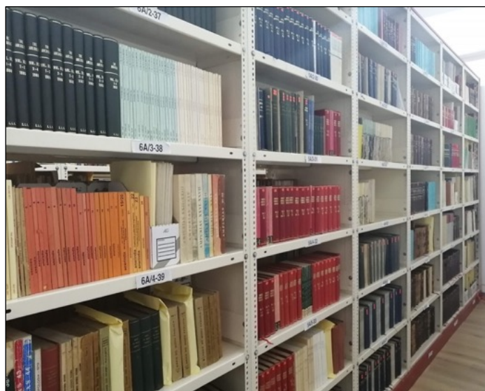
Imagen 15: Acervos documentales del PUIC

Ante la contingencia sanitaria por COVID-19, en 2020 se adecuó el procedimiento para brindar atención a consultas especializadas de investigadores nacionales y extranjeros, implementándose el servicio de consulta remota. Finalmente, se actualizaron y redactaron el Reglamento General de la Biblioteca Manuel Gamio y el Reglamento de Usuario, los cuales se encuentran en proceso de validación. Asimismo, se renovaron los directorios de bibliotecas y centros nacionales e internacionales de investigación, acerca de la multiculturalidad, la diversidad cultural, la interculturalidad y los pueblos indígenas de América.