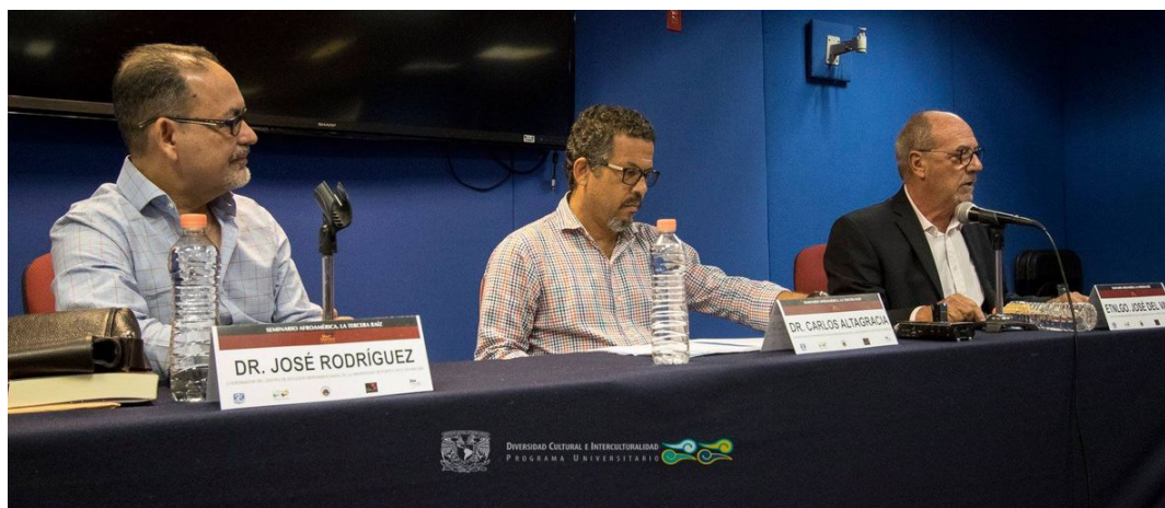
Imagen 7: Seminario permanente Afroamérica. La Tercera Raíz

destacar que en 2019, el PUIC coordinó las III Jornadas Internacionales de Estudios Afrocentroamericanos, en la Isla de Roatán, Honduras, del 19 al 22 de noviembre. Al evento asistieron representantes de diez organizaciones afrocentroamericanas, así como académicos de ocho universidades de siete países de América y Europa.