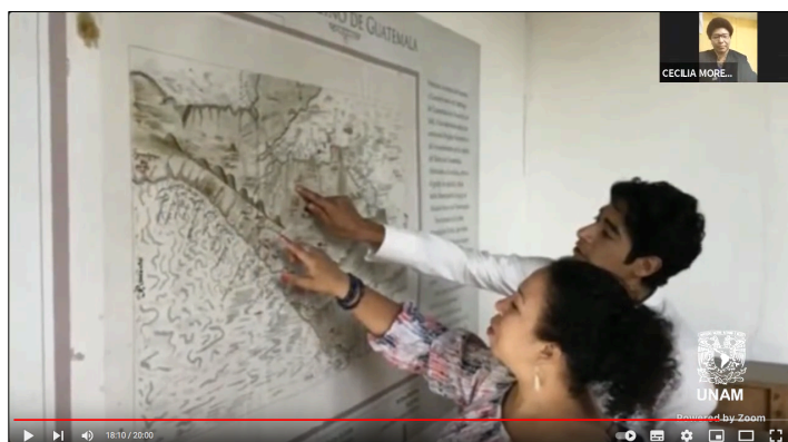
Imagen 20: Colaboración con instituciones académicas externas