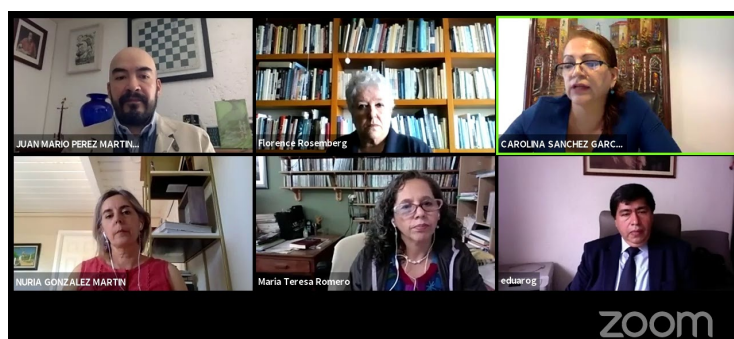
Imagen 11: Ciclo de Conferencias Virtuales: Violencia intrafamiliar en el marco de COVID-19