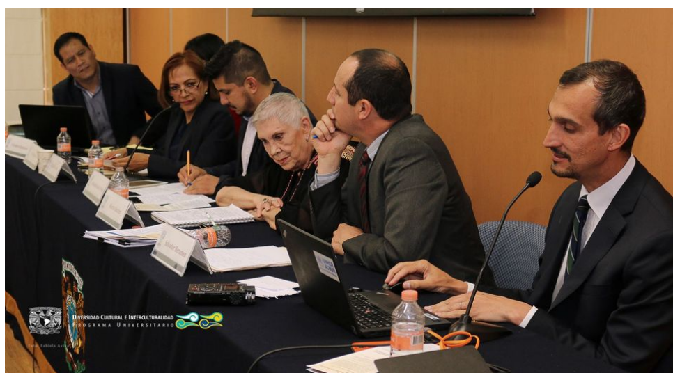
Imagen 19: Actividades de vinculación y colaboración

Parte esencial y estratégica de las tareas y operación del PUIC es la vinculación que establece con entidades académicas, tanto de la UNAM como externas, con dependencias de gobierno, de cooperación internacional, del Sistema de Naciones Unidas, con organismos no gubernamentales y civiles, y con organizaciones indígenas, afrodescendientes y colectividades de inmigrantes. En el periodo del informe se establecieron vínculos con las siguientes entidades.