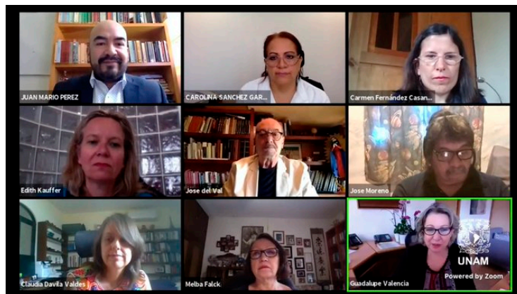
VIII Simposio Inmigración y Diversidad Cultural. Los mexicanos que nos dio el mundo, abril 2021.