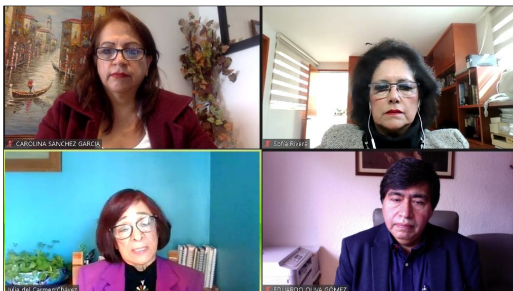
Imagen 4: Seminario Universitario: La familia en las sociedades contemporáneas

El Seminario reunió a destacados especialistas de la UNAM y de otras universidades, para reflexionar y analizar sobre la familia contemporánea, desde una visión multidisciplinaria, con el objetivo de generar recomendaciones para una nueva ley de relaciones de familia que incida en la política social, de manera particular, en el campo de la educación. Entre los temas que se abordaron destacaron: Reproducción asistida en México y Bioética; El derecho familiar mexicano en la actualidad; Dinámica familiar contemporánea; Laicidad, familias contemporáneas; Educación laica y educación religiosa, dos esquemas en la familia mexicana; Cambios en las familias mexicanas en el marco de la globalización; Desarrollo sustentable y familias en condición de pobreza; La familia mexicana y las transformaciones globales; Impacto de los movimientos migratorios en las familias mexicanas; Transculturación en las familias mexicanas migrantes; La familia desde la perspectiva de género; y Poder, género y familia. La segunda y tercera ediciones del Seminario (2018 y 2019) se llevaron a cabo en el Auditorio “Gabino Fraga” de la Facultad de Derecho de la UNAM, mientras que la cuarta y quinta (2020 y 2021) se transmitieron a través del canal de YouTube del PUIC, debido a la pandemia de COVID-19.