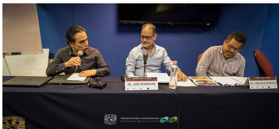
Imagen 3: Curso de Especialización en Estudios Afroamericanos

La onceava edición del curso se enfocó al tema “Teorías y metodologías desde una perspectiva comparada: Cuba y México”; se realizó del 1 de octubre al 5 de noviembre de 2019, con una duración de 24 horas. La coordinación estuvo a cargo del PUIC y la Universidad de Granma, Cuba, a través del Departamento de Gestión Cultural; se contó con la participación de cuatro ponentes de esa Universidad y la asistencia de 14 alumnos (seis extranjeros y el resto de distintas facultades de la UNAM y de otras universidades).