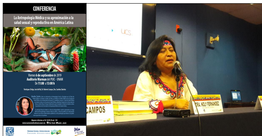
Imagen 5: Seminario interno sobre Diversidad Cultural e Interculturalidad